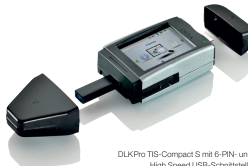
DLK Pro TIS-Compact S mit 6-PIN- und High Speed USB-Schnittstelle