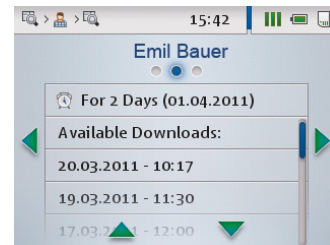
Detailansicht zu vorhandenen und anstehenden Downloads