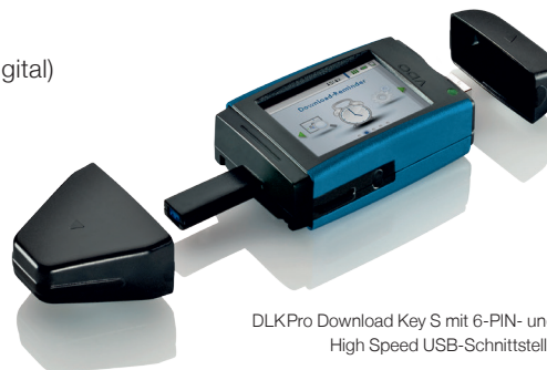
DLK Pro Download Key S mit 6-PIN- und High Speed USB-Schnittstelle

Bestell-Nr. DLK Pro Neoprene case: A2C59514917